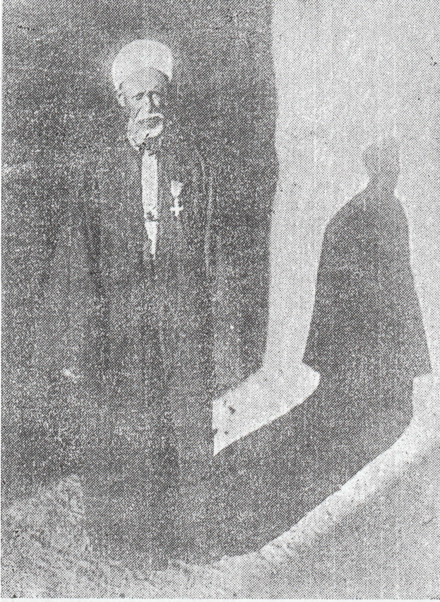
الشيخ أدريس عبد الله أمد الله في أيامه

أكبر قضاته الأستاذ الشيخ أدريس عبد الله . وقد استمر الحال على هذا المنوال حتى سقطت السلطنة الجديدة وقتل السلطان علي دينار في ١٩١٦ رحمه الله .